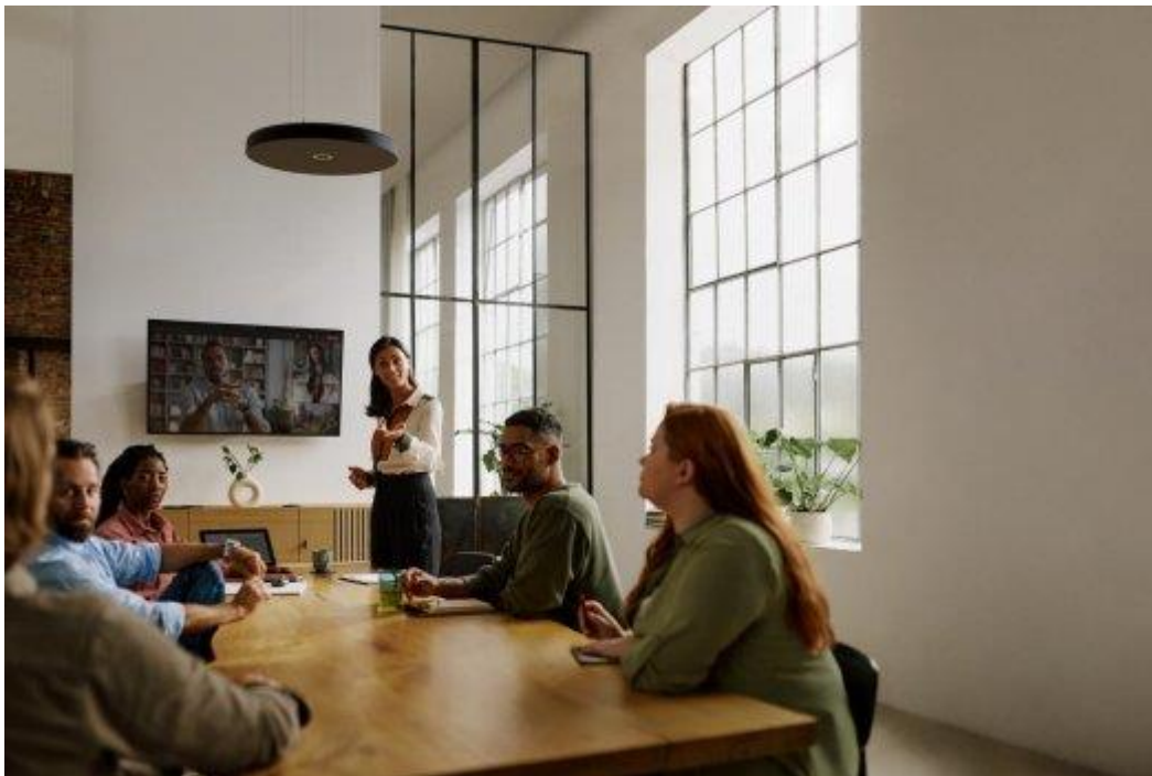
Figuur 1 De Q-SYS controleplug-in voor TCC M biedt een rechtstreeks beheer van de ledcontrole, audioniveaus, uitgangsversterking, mutefuncties, Sennheiser TruVoicelift, en luidsprekerpositionering binnen het Q-SYS controlesysteem

De Q-SYS controleplug-in voor TCC M is nu beschikbaar in Q-SYS Designer Asset Manager en biedt een rechtstreeks beheer van de ledcontrole, audioniveaus, uitgangsversterking, mutefuncties, Sennheiser TruVoicelift, en luidsprekerpositionering binnen het Q-SYS controlesysteem. Deze nieuwe toevoeging verbreedt het bestaande Sennheiser Q-SIS plug-in portfolio dat reeds de TCC 2-microfoon en het SpeechLine Digital Wireless-microfoonsysteem omvat, en breidt het potentieel voor drag-and-dropconfiguratie van Sennheiser-toestellen binnen eender welk Q-SYS systeem verder uit. Meer Sennheiser Q-SYS compatibele producten zijn te vinden op de Q-SYS partnerpagina op de Sennheiser-website.